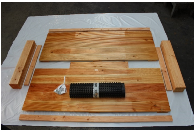
Hochbeetbausatz nach Auspacken inkl. Beschlag

Wichtig: Alle Schraubenlöcher vorbohren!